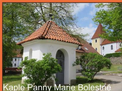
Kaple Panny Marie Bolestné

Již mimo jádro vsi je od 90. let 20. století klatovským muzeem postupně budován záchranný skanzen. Soubor historických lidových staveb z jihozápadních Čech je zde zastoupen několika roubenými objekty a dalšími hodnotnými budovami, kterým na jejich původním místě hrozil zánik. V severní části uzavírá ves hřbitov s kamennou ohradní zdí. V jeho sousedství je výklenková kaplička sv. Anny. VPZ byla v Chanovicích vyhlášena Ministerstvem kultury ČR od 1. ledna 2005.