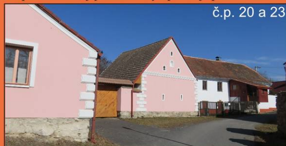
č.p. 20 a 23